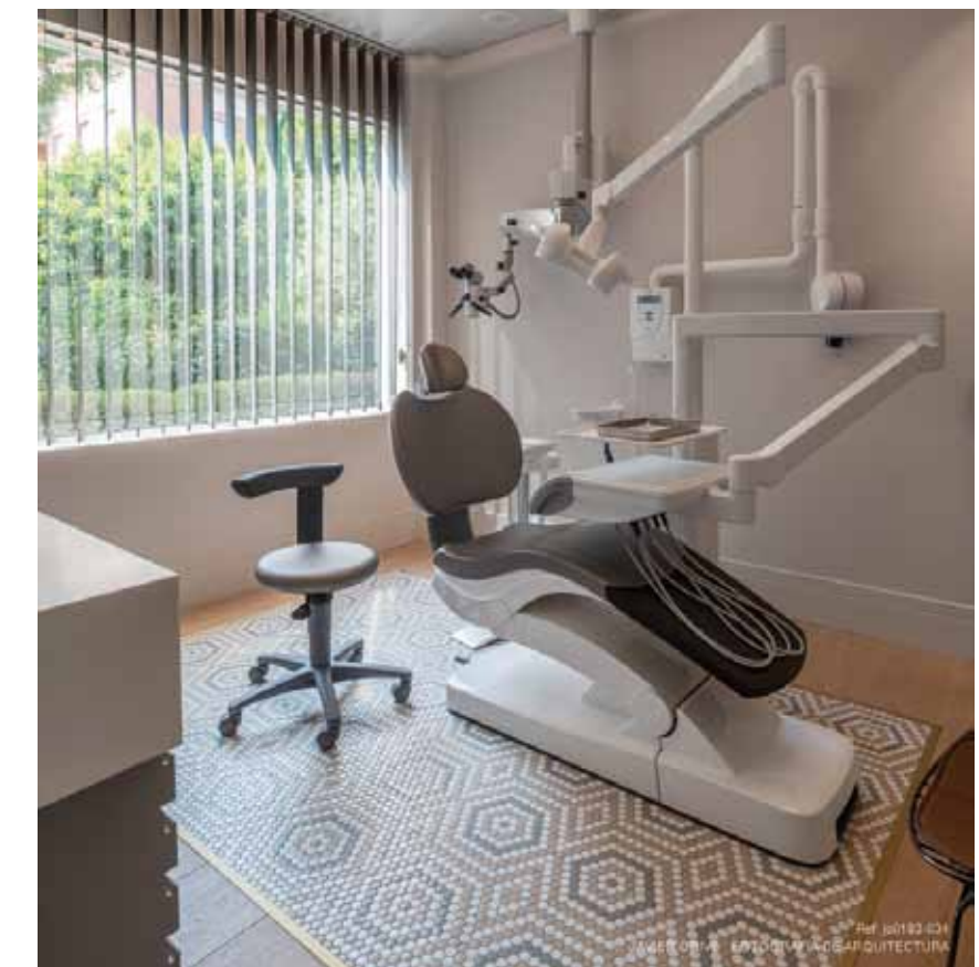
CLÍNICA DENTAL EN CÓRDOBA CON EL MODELO RADIAL DE LA COLECCIÓN ART FACTORY HISBALIT.